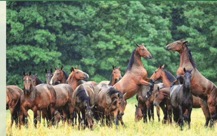
Warmblüter beim Klären der Rangordnung

Zu den im Betrieb gehaltenen Weidetierarten gehören die auf der Titelseite dargestellten Rinderrassen Angus und Heckrinder, eine Nachzuchtung des früher hier beheimateten Auerochsen, sowie Wasserbüffel. Bei den Pferden handelt es sich um Warmblut-Pferde und Koniks, die Rückzüchtung einer europäischen Wildpferdform. Teile der Grünlandflächen, vor allem in Erholungsorten sowie Naturschutz- und Wiesenbrüter-Fördergebieten, werden als Mähwiesen zur Winterfuttermittelgewinnung bewirtschaftet.